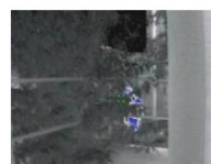
Modo PERSONAS DESAPARECIDAS